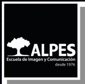
IMAGEN Y CONTENIDO DIGITAL PARA SOCIAL MEDIA